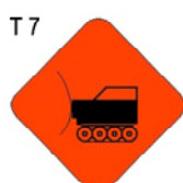
EQUIPO PESADO EN LA VIA