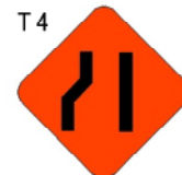
ESTRECHAMIENTO DE CALZADA