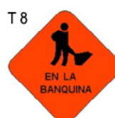
TRABAJOS EN LA BANQUINA