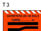
CARRETERA DE UN SOLO CARRIL