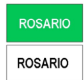
IDENTIFICACION DE REGIONES Y LOCALIDADES