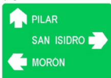
ORIENTACION (En caminos primarios y secundarios)